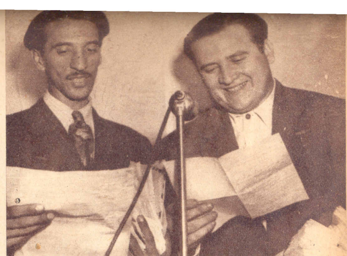
EXITOSO FINAL DE "CARCEL DE HIELO"