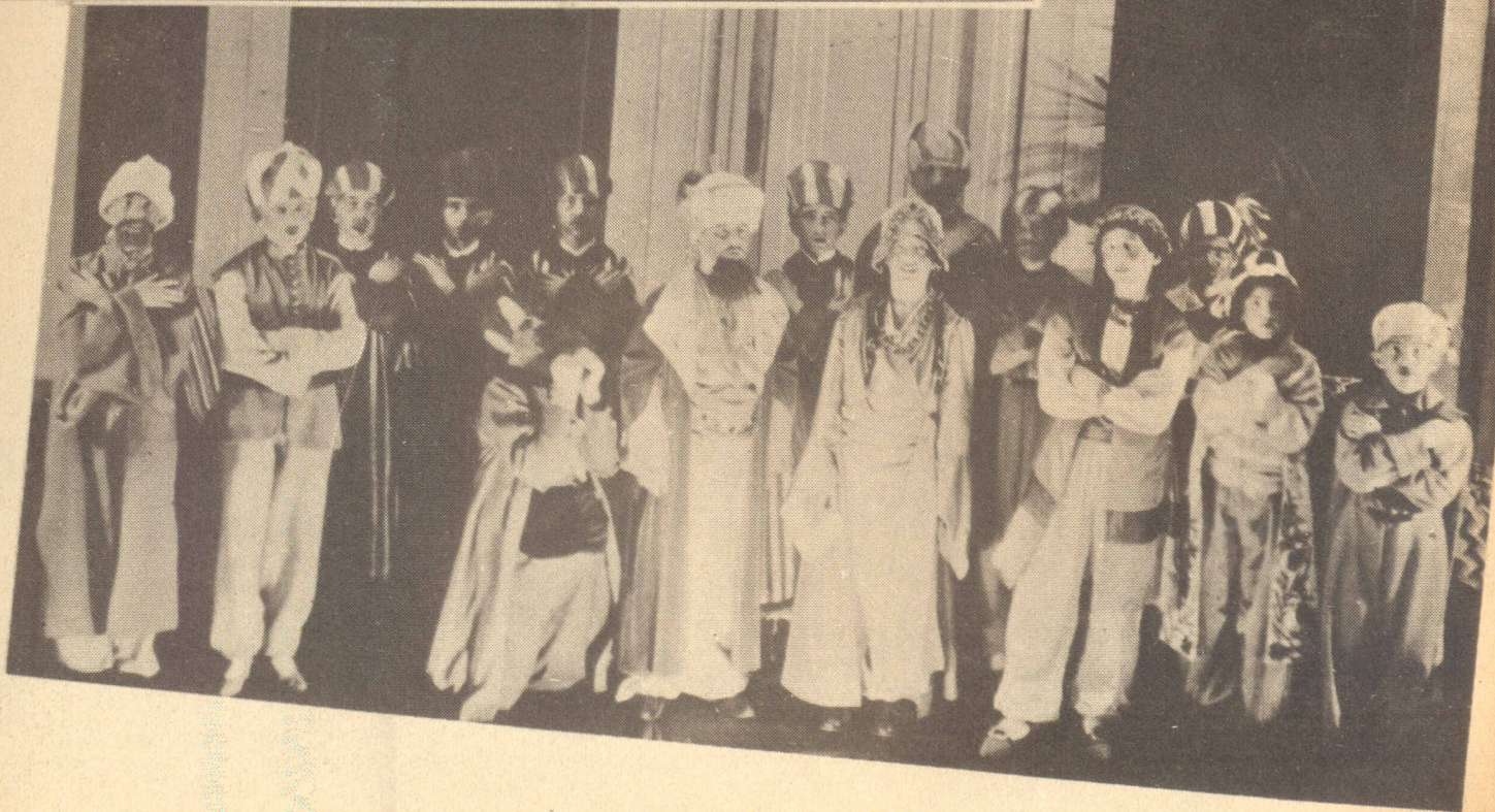
UNA ESCENA de "El Farmacéutico", ópera en un acto de Haydn.