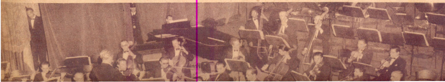
LA ORQUESTA SINFONICA VENEZUELA: que bajo la brillante dirección del Maestro Sojo interpretó obras musicales de gran valor con verdadero acierto.