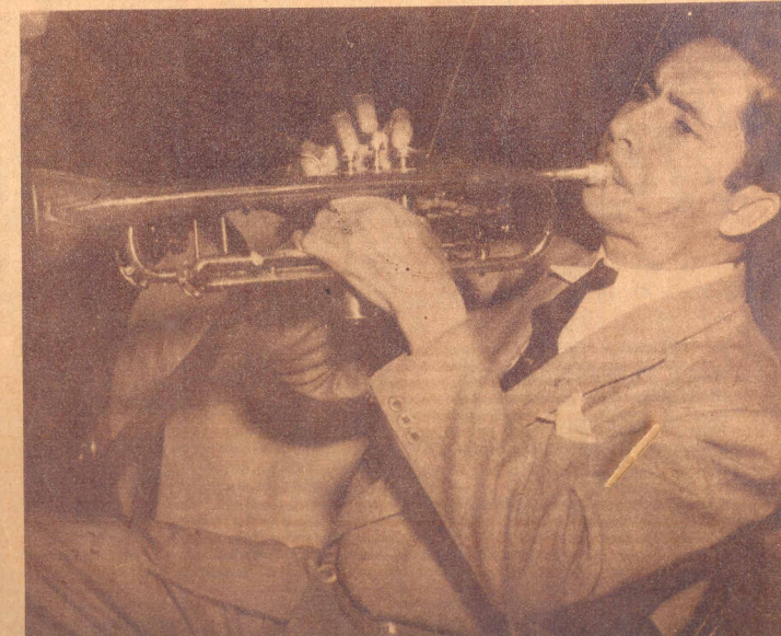
NUEVA ESTRELLA RADIAL