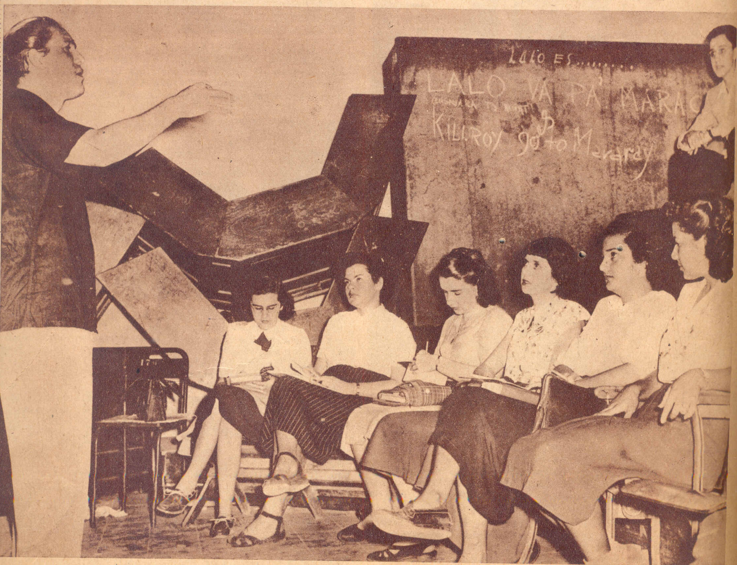
TELÓN DE FONDO. —Con un telón de fondo travieso y decididamente estudiantil, lleno de alusiones al invisible y