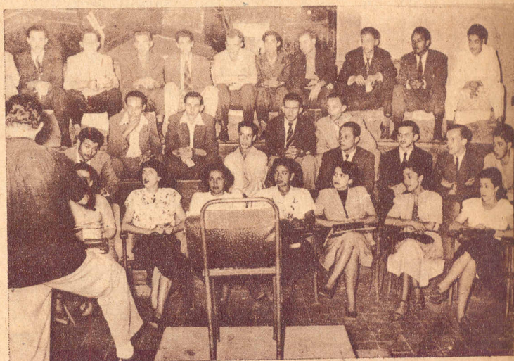
ENFOQUE. —En la tarima de los ensayos los jóvenes orfeonistas universitarios se preparan para ensayar el Turututú de Miguel Angel Calcaño, magnífica expresión del alma popular venezolana.

De 1943 a 1946 el Orfeón Universitario efectuó numerosos conciertos en esta capital y en algunas capitales de Estados, tales como Los Teques, Maracay, Valencia etc. Contaba en esta época el Orfeón con 120 voces mixtas. En la actualidad el número de componentes se ha reducido a 80.