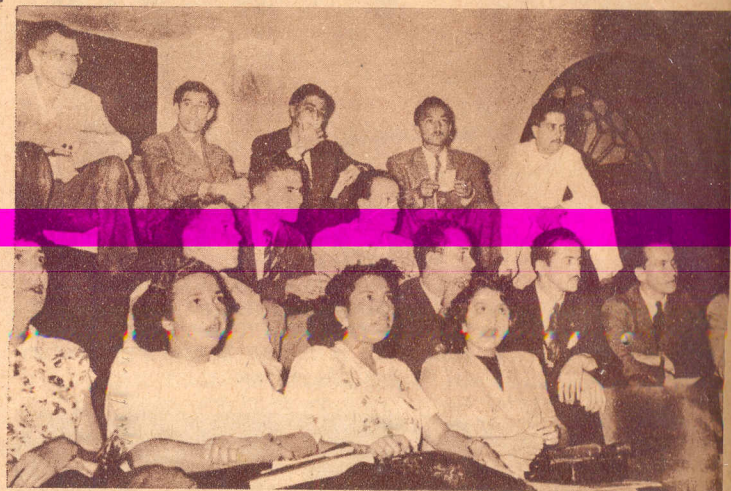
AFINANDO. —Con diversas y curiosas expresiones en los juveniles rostros, unas de sustos, otras de perplejidad, las más de interés, los orfeonistas se preparan a dar el "sí" para que la pieza comience. El joven orfeonista de liquilliqui blanco observa el resultado del "sí".