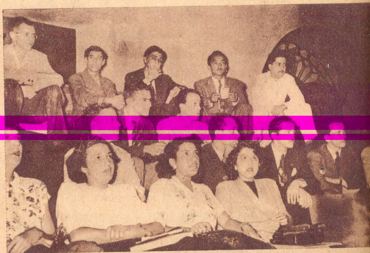
AFINANDO. —Con diversas y curiosas expresiones en los juveniles rostros, unas de sustos, otras de perplejidad, las más de interés, los orfeonistas se preparan a dar el "sí" para que la pieza comience. El joven orfeonista de liquilique blanco observa el resultado del "sí".