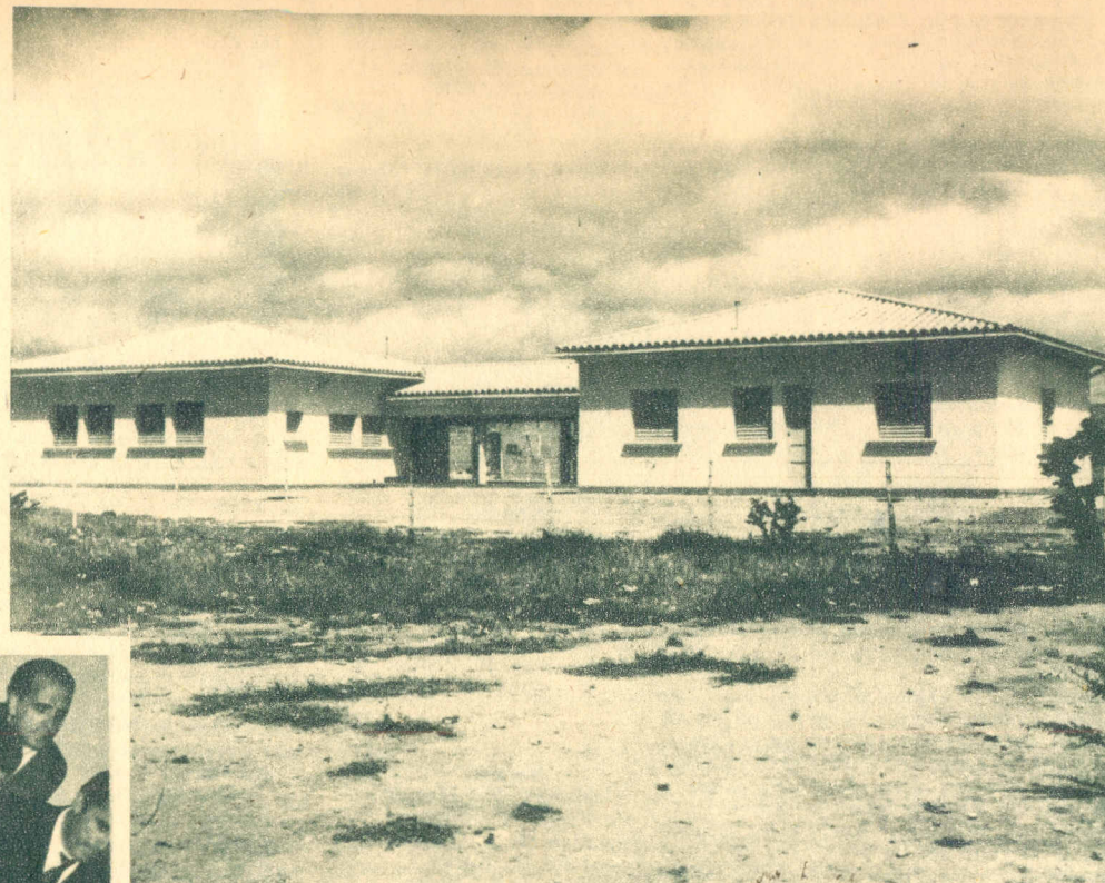
Moderno edificio donde funciona la Comisionaduría del Trabajo de Punto Fijo, Estado Falcón. Ha sido recientemente inaugurado.