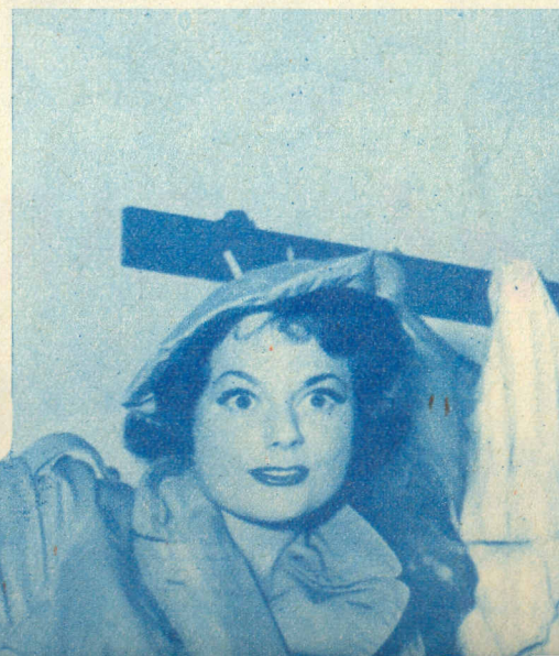
Hasta que no aguanté más y nos eché del camerino...