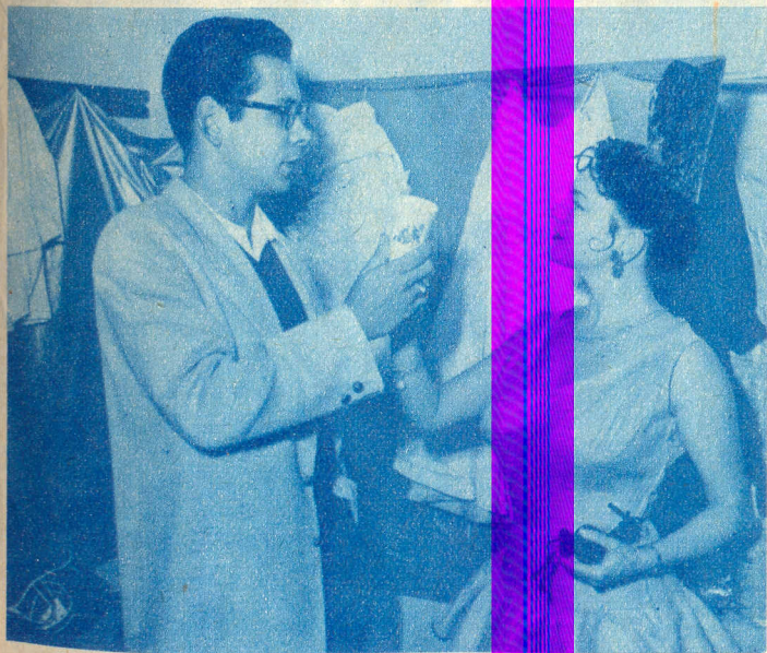
Buena suerte Tita.