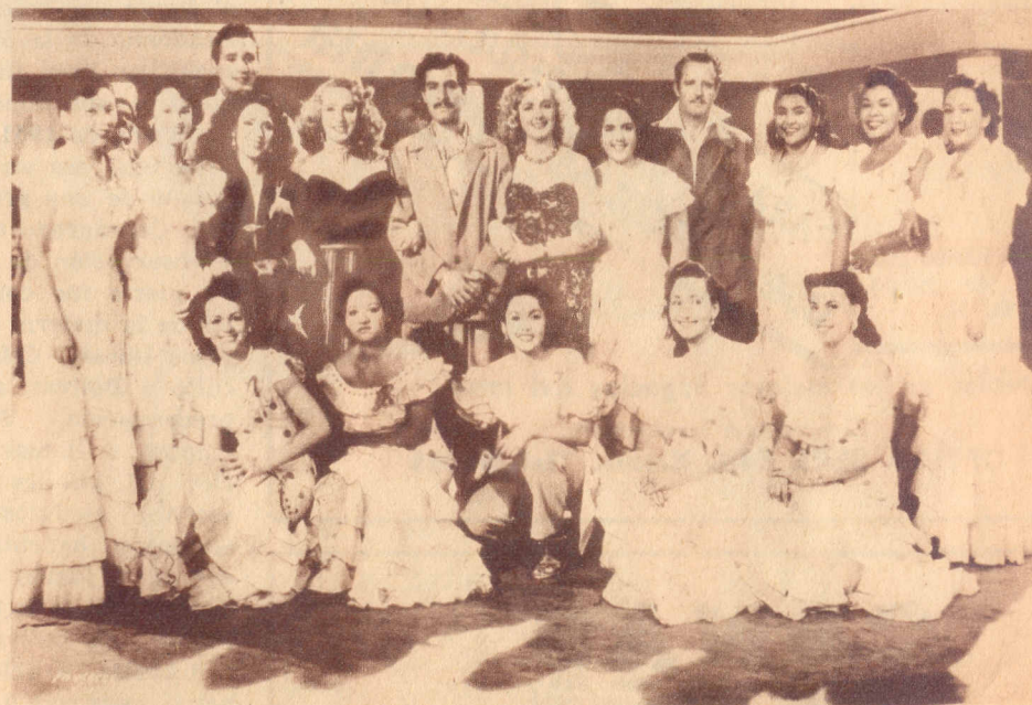
Las integrantes del "Anacaona" durante la filmación de "Mujeres de Teatro", en México, con estrellas del cine mexicano: María Victoria (primera de izquierda, vestida de oscuro), Rosita Fornés, el famoso "Resortes", Emilia Guiú y René Cardona.