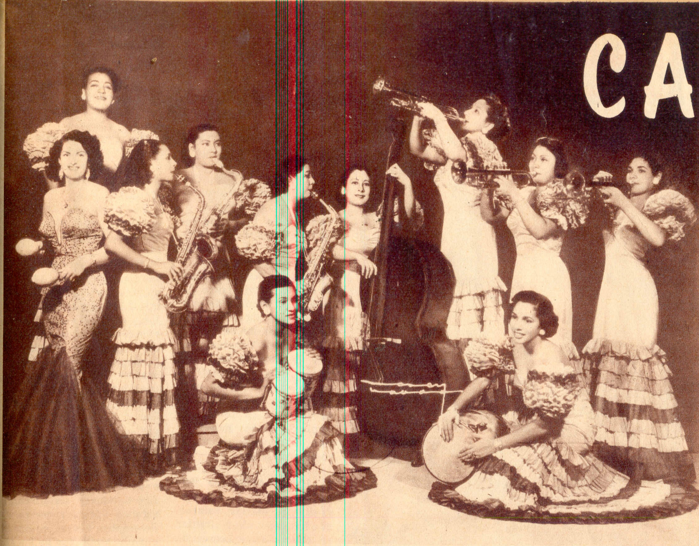
La orquesta cubana "Anacaona"