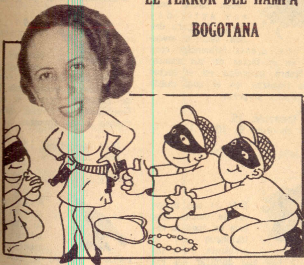
DURANTE ESE VIAJE a Bogotá unos rateros le robaron su cartera en las calles de la ciudad, pero los identificó más tarde y los hizo detener por la policía. Con tal motivo "El Morrocoy Azul" le dedicó esta caricatura.