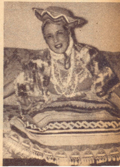
LA COMPOSITORA siente pasión por todo lo relacionado con el indígena. Ha transcrito su música y gusta de posar, como en esta foto, ataviada con trajes autóctonos. Dice que su ángel guardián es el Indio Guacaipuro.