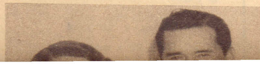
LA COMPOSITORA siente pasión por todo lo relacionado con el indígena. Ha transcrito su música y gusta de posar, como en esta foto, en...