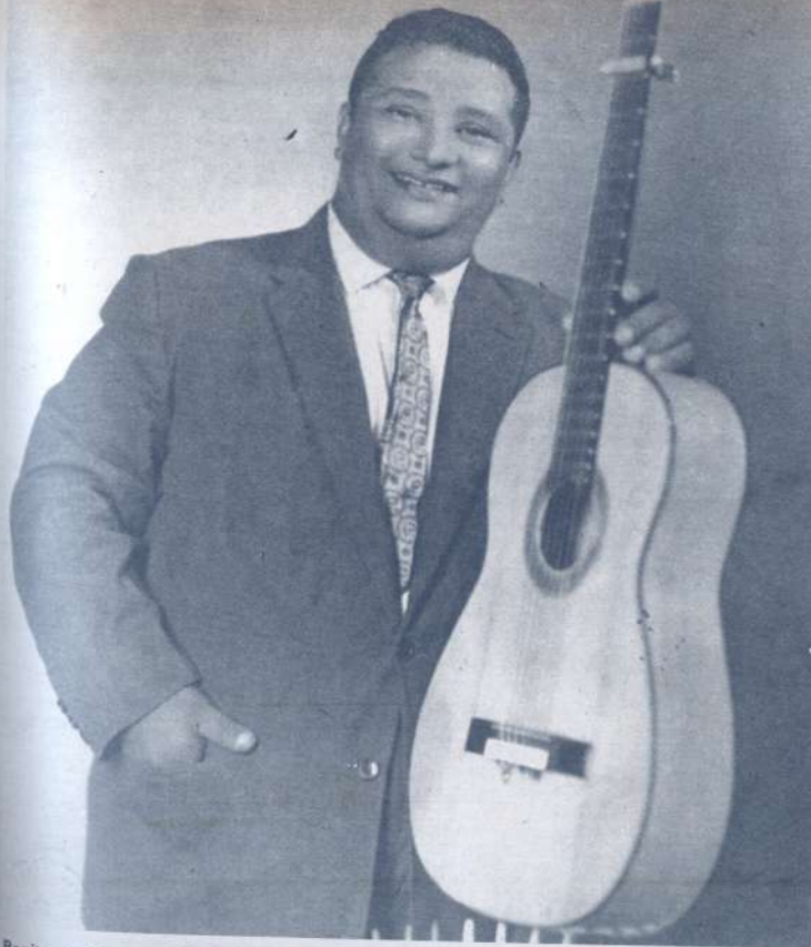
Benito Quirós, mundialmente conocido como intérprete de nuestro canto criollo, vive modestamente en una haciendita de los alrededores de Maturín, víctima del boycott que le ha declarado el medio artístico venezolano.

tral hidalguía del pueblo monaguense. Y así fue como en las tierras calientes de Maturín Benito Quirós sentó sus reales, con sus 107 kilos, su adorada Juanita Mendoza y un porvenir nada halagüeño. Un exiguo sueldo en Radio Monagas y los productos de su terruño.