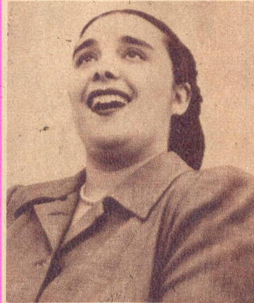
La voz surge brillante y cálida en los tonos que requieren esa fuerza de expresión.