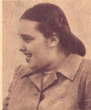
La cantante subraya con el gesto la vibrante voz de una sentencia...