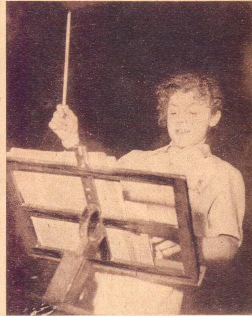
"Con brío" . . . .