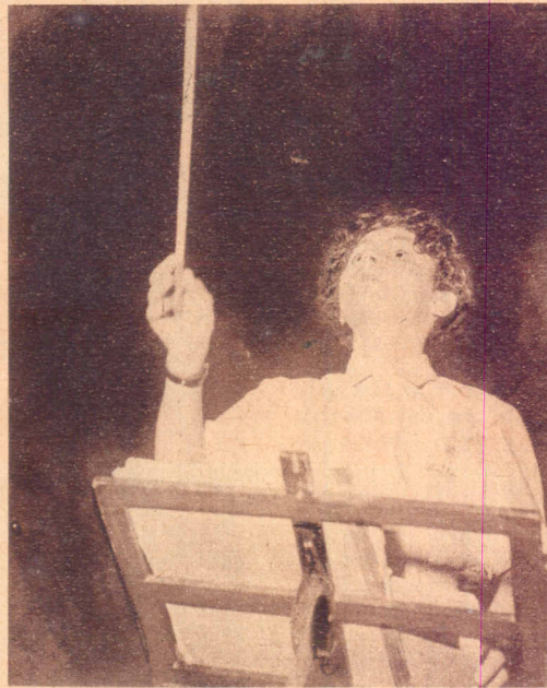
"La flauta" . . . .