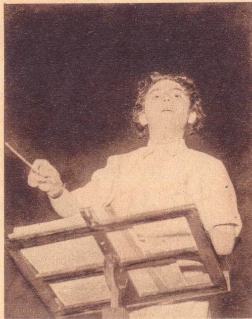
"Cuidado" . . . .