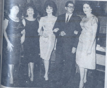
durante su reciente viaje a Nueva York, fue agasajado por las figuras latinas más destacadas de Hollywood allí. En la gráfica lo vemos rodeado por algunas de ellas, entre las que cabe destacar a la famosa Graciela, vocalista de la internacional orquesta de Machito y sus Afro-Cubans.