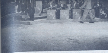
Poco antes de dar comienzo a uno de sus programas de Televisión, los componentes de "Los Melódicos" reciben las últimas instrucciones de Renato, quien vemos de espaldas a la cámara.