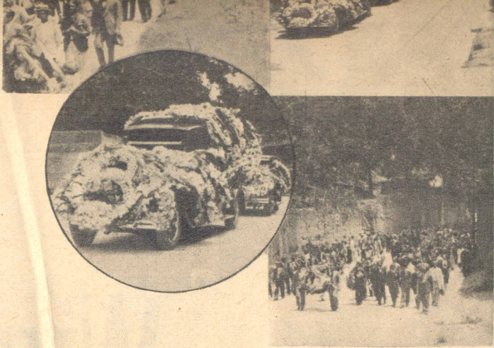
Aspectos de la imponente manifestación de duelo con motivo de las exequias del Dr. Luis Razetti.